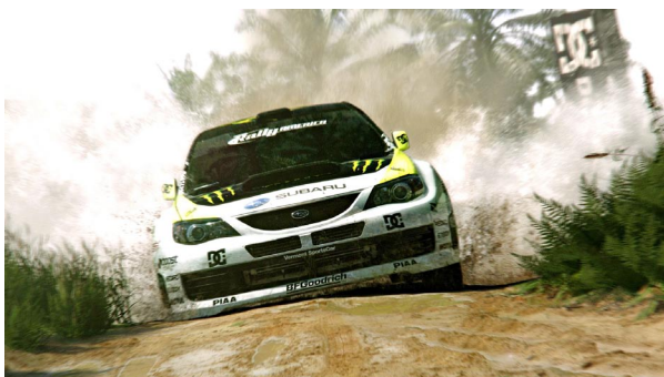
Neue Wasser-Physik soll Fahrten durch Pfützen zum spektakulären Erlebnis machen.