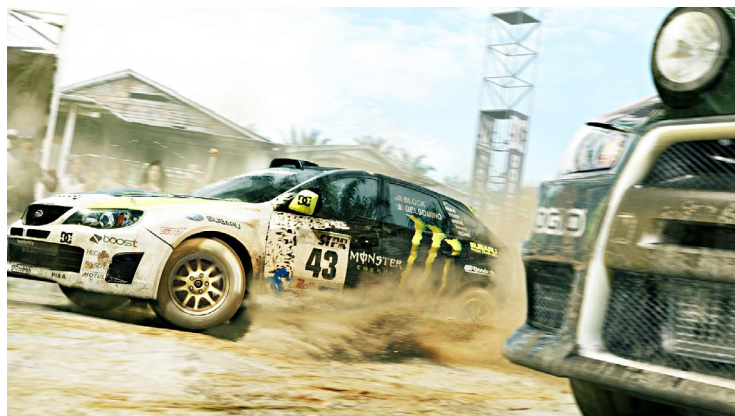
Malaysia steht zum ersten Mal auf dem Wettkampfkalender der Colin-McRae-Serie.