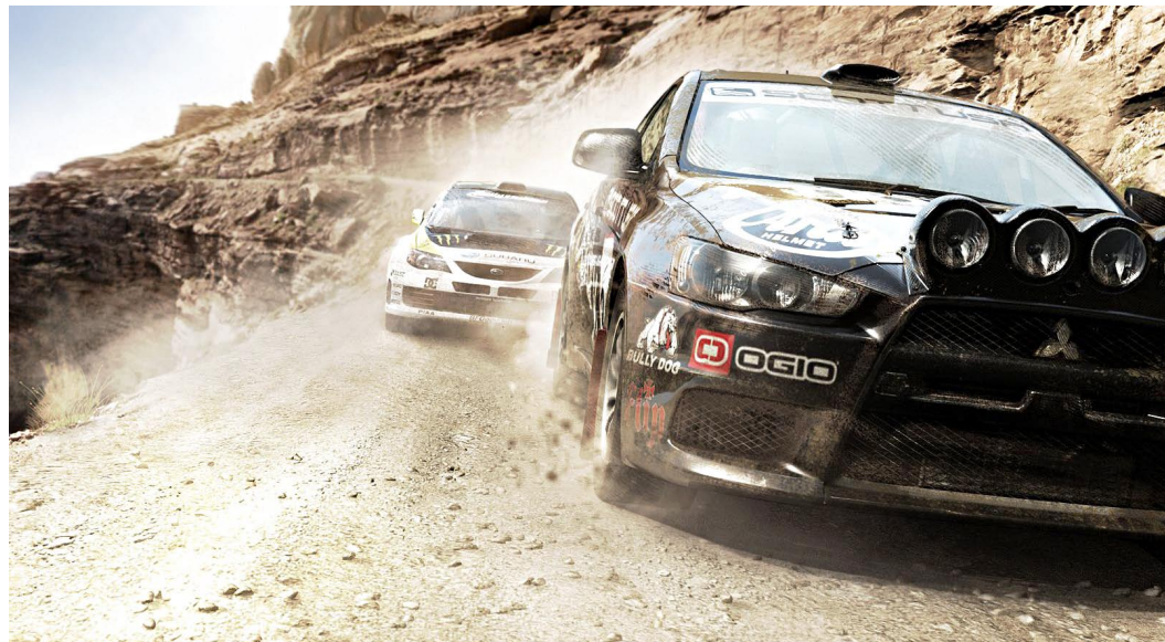
Im neuen Trailblazer-Wettbewerb klettern wir nicht nur die Berge hoch, sondern rutschen auch wieder hinunter.

Gewonnene Preisgelder werden wir wie im Vorgänger in erster Linie in neue Autos investieren. Management-Elemente wie in Grid sind nicht geplant. Askew begründet die Entscheidung: »Das passt einfach nicht zum Offroad-Sport – es geht nur um dich, deinen Wohnwagen und deine Freunde.« Aha, Freunde – also doch ein neues Karriere-Element? Askews Auskunftsfreude nimmt rapide ab, dennoch lässt er sich zumindest ein paar Andeutungen entlocken. So werden wir im Verlauf der Karriere tatsächlich Freundschaften mit anderen Fahrern schließen dürfen, darunter sogar lizenzierte Stars wie der mehrfache X-Game-Gewinner Travis Pastrana. Diese Freunde sollen uns in erster