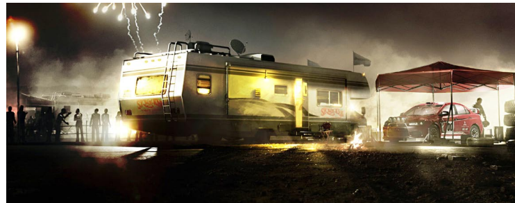
Der Wohnwagen ist einerseits Hauptmenü , andererseits unser Zuhause im Karrieremodus.