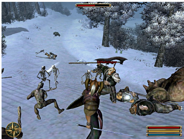
Unsere frisch beschworene Armee der Finsternis setzt einem Ork gehörig zu.

einhalb Jahren auf dem Buckel. Damit Sie mit frischer Motivation nochmals losziehen können, haben sich Fans daran gemacht, die Spielwelt mit neuen Inhalten zu