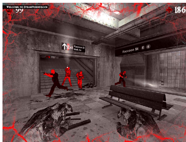
Dank Zombievision erspähen die Untoten ihre rot leuchtenden Opfer auch im Dunkeln.

Allerdings enthält jede Pistole zu Beginn nur sehr wenige Patronen, der Zombie hingegen kann immer wieder ins Spiel einsteigen. Und wie steter Tropfen den Stein höhlt, so erbeutet der Untote früher oder später seinen ersten Überlebenden. Der wechselt nun die Seite und wird als Zombie wiedergeboren. Jetzt gehen zwei Monster auf die Jagd, und die Seuche breitet sich aus. Apropos: Mit ein bisschen Glück kann eine Zombieattacke sein Opfer infizieren. Der Erkrankte mutiert dann nach einer Weile automatisch zum Menschenfresser – eine böse Überraschung für die Überlebenden. Die können sich zwar an Engstellen verschanzen, etwa auf dem Dach einer Tankstelle oder hinter dem Altar einer Kirche, doch da geht ihnen schnell die