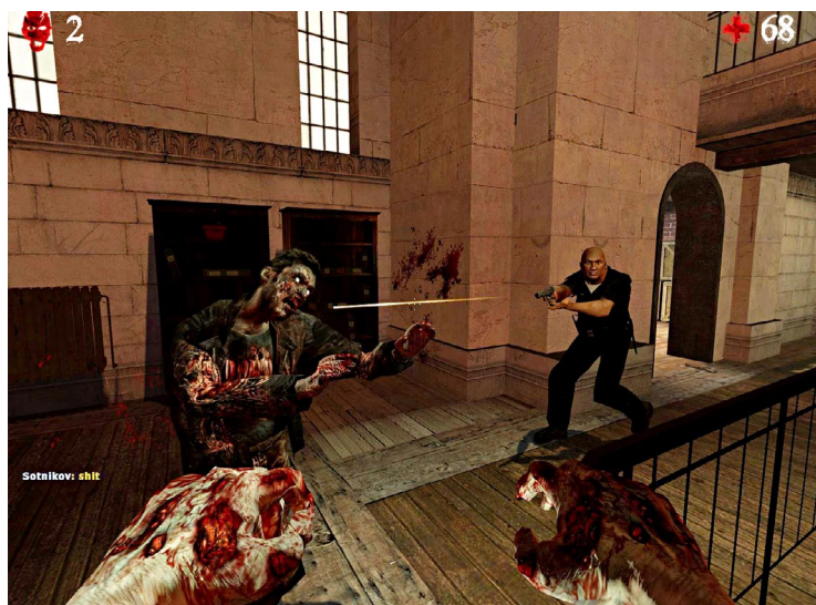
Zu den beiden Menschen-Spielfiguren (Rocker und Polizist) gibt es passende Zombiemodelle .

Flucht mit einer U-Bahn. Dazu müssen die Menschen nacheinander mehrere Aufgaben erfüllen: in Abschnitt A ein Tor öffnen, in Abschnitt B einen Generator anschalten und so weiter, bis der Zug schließlich fahrbereit ist. Anschließend flüchten sich alle Überlebenden innerhalb eines Zeitlimits in die U-Bahn, um zu gewinnen. Hier wird Zombie Panic richtig spannend, auch wenn die Mod an einigen Stellen noch unfertig wirkt. Die Kollisionsabfrage bei den Nahkampfattacken ist ein wenig ungenau, und die Sprints der Zombies sind ziemlich lahm – wir hätten uns einen Sprungangriff wie in Alien versus Predator 2 oder eben Left 4 Dead gewünscht. Bis das im Herbst erscheint, können Sie sich jedoch mit Zombie Panic jetzt schon in Stimmung bringen. FAB