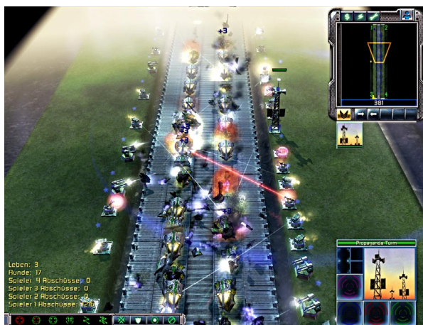
Die Schlachten sind trotz vieler Gegner immer noch übersichtlich .

Spätestens, wenn die ersten gepanzerten Fahrzeuge auftauchen, sind kleine MG-Türme nicht mehr effektiv genug. Entsprechend größere Anlagen bezahlen Sie mit dem Geld, das Sie für aufgehaltene Einheiten und erfolgreich gemeisterte Gegnerwellen bekommen. Hier kommt die Taktik ins Spiel: Jeder Gegnertyp ist anders gepanzert. Sie müssen mit Waffen kontern, die effektiv gegen entsprechende Panzerung sind. Zusätzlich können Sie noch Sende-