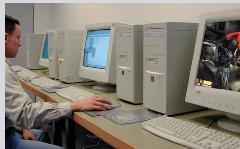
Der Schnappschuss zeigt einen Teil des Testcenters.

In unserem Testcenter stehen diverse vorkonfigurierte PCs, auf denen die GameStar-Hardware-Abteilung die Spiele mit verschiedenen Prozessortypen, Grafikkarten und Speicherkonfigurationen auf Herz und Nieren testet – insgesamt 200 praxisnahe Kombinationen. Die Ergebnisse schlagen sich im Wertungskasten bei den Hardware-Angaben und 3D-Karten sowie in unseren detaillierten Technik-Checks nieder.