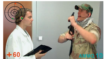
Die Redaktion: Das Spiel

Haben auch Sie die Schnauze voll von Weltkrieg, Mittelalter und Elfen-Zwerge-Fantasy? Wünschen auch Sie sich originelle Spielideen? Dann packen Sie's an und entwerfen Sie ein eigenes PC-Programm! Wichtig: Ihre Idee sollen Sie nicht einfach niederschreiben, sondern illustrieren – etwa mit einem Foto, einer geklebten Collage oder einem gezeichneten Screenshot. Ein schlechtes Beispiel sehen Sie rechts: