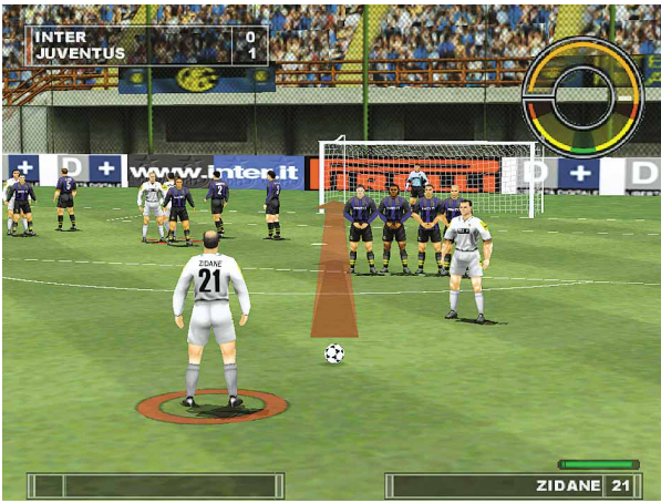
Ein Superstar mit schütterem Haar beim Freistoß: Zinedine Zidane.

Für geldgierige Fußball-Manager ist sie schon längst ein Thema: die europäische Superliga. Virgin hat sich die Lizenz des noch fiktiven Alptraums deutscher Stadion-Gänger gesi-