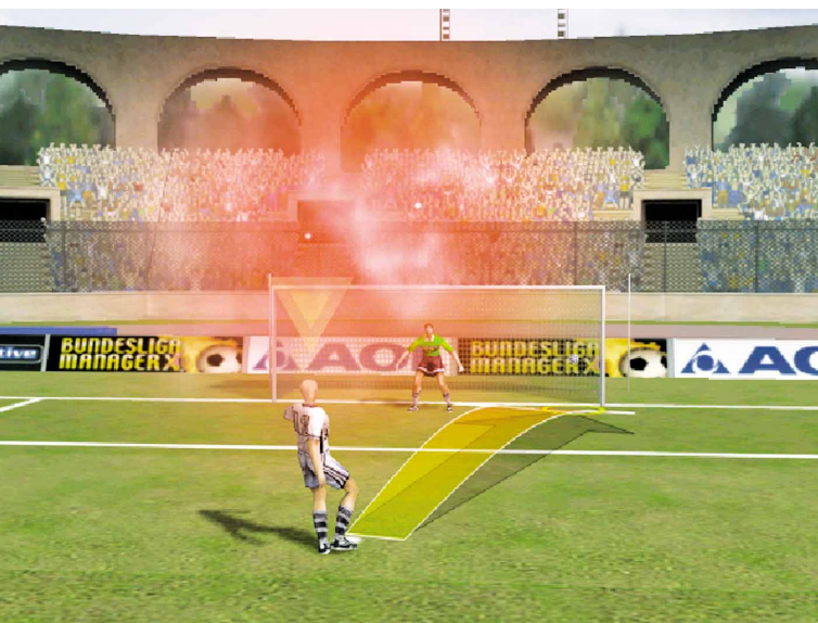
Schicke Effekte wie das bengalische Feuer sorgen für Stadion-Atmosphäre.

wird zu München 1820. Wer diese Namensänderungen rückgängig machen will, kann auf den beiliegenden Editor zurückgreifen. Damit ändern Sie per Mausklick auch sämtliche Spielerdaten oder stellen sich gleich neue Ligen zusammen. Das bietet sich vor allem an, wenn Sie mit ein paar Freunden ganz eigene Meisterschaften austragen wollen. Allerdings müssen die maximal acht Teilnehmer sich einen PC teilen; ein Netzwerkmodus fehlt. Dummerweise kann man kein Zeitlimit einstellen – Streitereien über die Dauer des Spielzugs sind fast vorprogrammiert. MIC