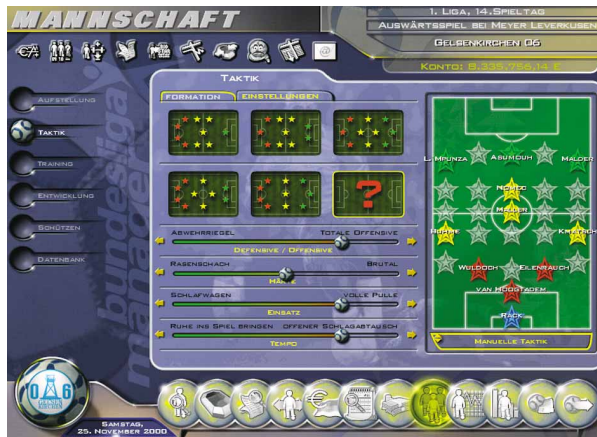
Bei der Aufstellung passen die Spieler nur in vorgegebene Raster.

Der Managerpart umfasst alle gewohnten Standardfunktionen wie Stadion- und Umfeldausbau oder den Abschluss von Werbeverträgen. Außerdem legen Sie die Eintrittspreise fest und bieten im eigenen Fanshop Merchandising-Artikel an. Ebenfalls in diesen Bereich fallen die Vertragsverhandlungen. Mit einem