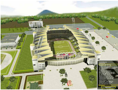
Den Ausbau von Stadion und Umfeld können Sie sich in schönem 3D anzeigen lassen.

dichtzumachen und auf Konterchancen zu lauern? Fünf vorgegebene Offensiv- und Defensiv-Taktiken liefert der Bundesliga Manager X vorgefertigt mit. Sie können Ihre Mannen aber auch nach eigenen Wünschen auf dem Feld verteilen. Allerdings müssen Sie sich an die Vorgaben eines engmaschigen Rasters halten. Die Automatikfunktion nimmt Ihnen lästige Standardaufgaben ab. Eine Möglichkeit, sie wie beim Kicker Fußball Manager 2 individuell zu konfigurieren, gibt es allerdings nicht.