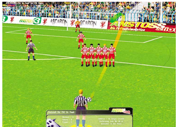
Mit so einer Flugkurve ist ein Freistoß-Erfolg fast vorprogrammiert.

Die Grafik von Anstoss Action besitzt durchaus internationale Klasse. Besonders bei den Stadien hat sich Ascaron viel Mühe gegeben. Elf real existierenden Fußball-Arenen haben die Pro-