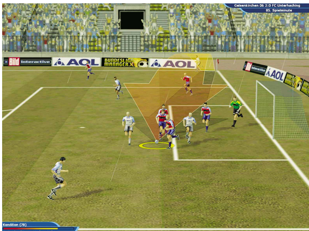
Kondition (78) F. Gaudes (Gelsenkirchen 06)

Grafisch bewegen sich die Kicker im Mittelfeld. Die Anima-