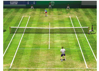
Vier Platzvarianten stehen zur Auswahl.

Publisher Cryo zeigt wie fast jedes Jahr ein Herz für die vernachlässigten PC-Tennisfans. Im Sportspiel Roland Garros 2001 ist der titelgebende französische Profi nur einer von 32, teilweise erst freizuspielenden Filzjongleuren beiderlei Geschlechts. Auch die mehr als 20 Courts stehen nicht komplett von Anfang an zur Verfügung, sondern müssen sich nach und nach erkämpft werden. Grafisch stechen vor allem die guten Animationen und gefälligen Plätze hervor – das hässliche Publikum sollten Sie besser nicht beachten. Gewöhnungsbedürftig auch die indirekte Steuerung, da Sie Ihrem Spieler nur die Richtung und die Art des Schlages vorschreiben. Dank der guten Trainingsmodi lässt sich das Problem jedoch schnell in den Griff bekommen. Das Spiel ist zwar kein High-