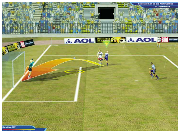
Gelsenkirchen im Angriff: Gleich wird das 1:0 gegen Cottbus fallen.

wilden Mix aus Monatsgehältern, Prämien und Laufzeiten versuchen Sie, Spitzenkicker für Ihren Verein zu ködern. Über Erfolg oder Misserfolg informiert Sie einige Spieltage später eine schmucklose E-Mail.