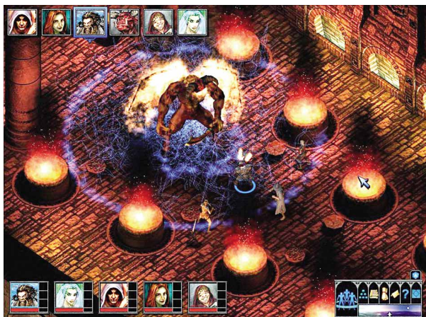
Obermotze wie der Feuerdämon schützen sich per Zauberschild.