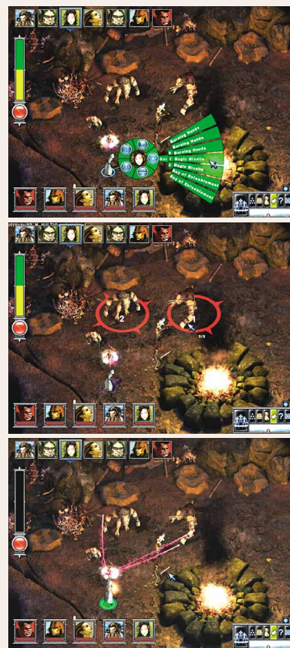
Bei Feindkontakt schaltet das Programm in den Rundenmodus. Der gelb-grüne Balken links verrät, wie oft Sie pro Runde angreifen oder gehen können. Per Kontext-Menu wählen Sie erst den passenden Zauber aus. Dann klicken Sie in der gewünschten Reihenfolge auf die Orks und sehen zu, wie Ihr Magier seine magischen Pfeile abfeuert.

für alle, die das D&D -Regelwerk zum Frühstück verputzen: den »Ironman«-Modus. Jederzeit speichern fällt aus. Tote Partymitglieder lassen sich weder wiederbeleben noch ersetzen. Und bei der Charaktergenerierung dürfen Sie pro Held nur einmal Statuspunkte auswürfeln – wenn Sie Pech haben, sind Sie mit einem Trupp aus Luschen unterwegs. PS