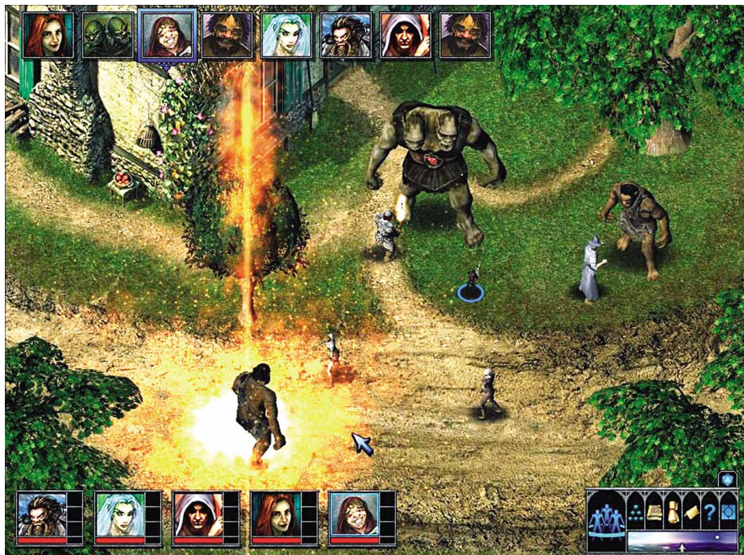
Ein Zauberer attackiert den fiesen Ork per magischem Meteorschlag , und unser Paladin kümmert sich wenig später um den Oger (oben).

Die Handlung des Spiels dreht sich um den »Tempel des abgrundtief Bösen«, wie der Titel von Temple of Elemental Evil auf Deutsch hieße. Eigentlich sollen Sie eine simple Rettungsaktion nahe des riesigen Heiligtums durchführen. Dann stellt sich jedoch heraus, dass in dem Gemäuer eine missgünstige Königin unbekanntenen Ursprungs haust. Die Entwickler versprechen, dass sich die Story