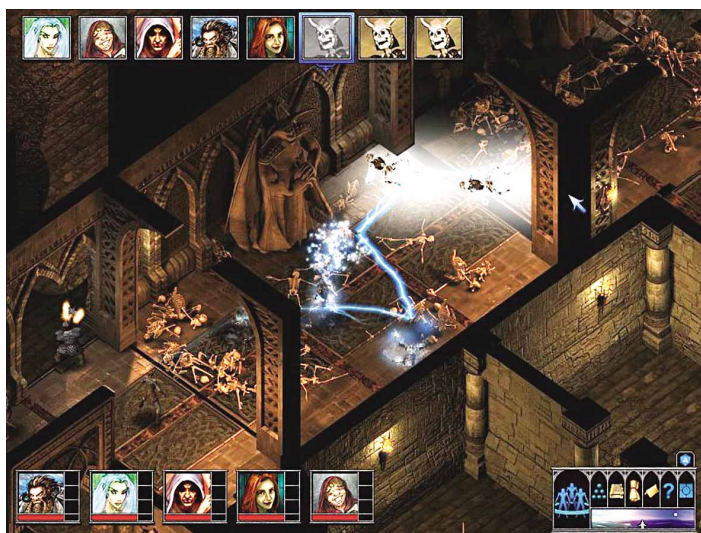
Die Skelettkrieger in den Katakomben sind nur in Massen eine Gefahr.

sich allerdings für einen bösen Trupp entscheidet, muss zu Beginn erst mal brave Wachleute meucheln. Die Entwickler schätzen, dass durchschnittliche Spieler allein mit der Hauptkampagne um die 50 Stunden beschäftigt sind; dazu kommen unzählige Nebenquests.